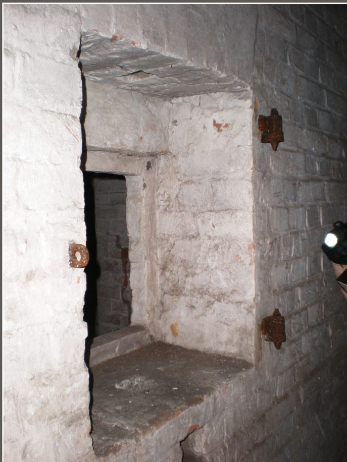
nisza na latarnię i okno oświetleniowe w ścianie magazynu amunicji