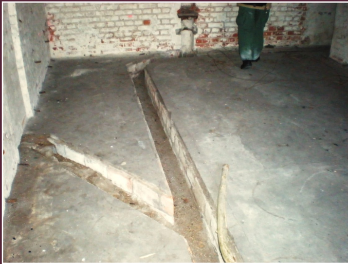
ślady po instalacjach wodnych w izbach żołnierskich