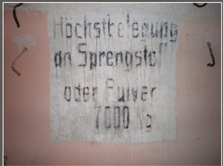
Höchstbelegung an Sprengstoff oder Pulver 7000 kg